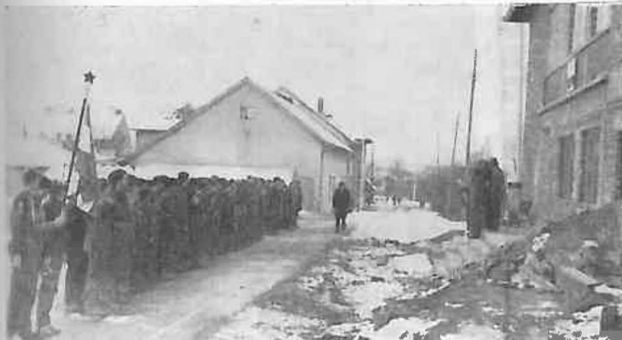
Slika 2. Odred je formiran. Na čelu odreda je zastava slavnog Posavskog partizanskog odreda koja je prije 25 godina na čelu jedinica Jugoslavenske armije ponosno umarširao među prvima u Zagreb. Zastavu Posavskog partizanskog odreda na čuvanje, kao i simbol herojstva ove jedinice, predala je Skupština općine Dugo Selo 29. ožujka 1969. u Oborovu omladinskom odredu.