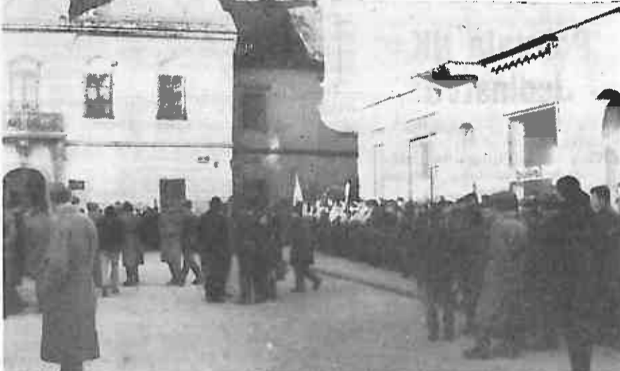
Slika 6. Druga akcija — Varaždin. Nismo baš skromni. Svega nas 120 s dva autobusa pošli smo u osvajanje ni manje ni više nego Varaždin. Stigavši na korzo postali smo centar pažnje prisutnih Varaždinaca. Gostoljubivi Varaždinci omogućili su nam da ne samo da osvojimo već i upoznamo Varaždin i njegove historijske znamenitosti. Naveče u Domu JNA susret s mladima iz njihova lijepa grada uz razumije se obavezan ples. (Ej vi stari opet ćete nam prigovoriti. A kada se u partizanima nije plesalo.) Uz zvukove električnih gitara neki su pričali o taktici, a neki primjenjivali taktiku osvajanja. Tko je konačno osvojen — to ne znamo.