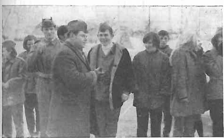
Slika 3. Bez obzira što manje - više poznamo okolicu u kojoj ćemo dok ne stasamo za vojnika i u slučaju rata djelovati, poznavanje orijentacije na zemljištu, busole, karte specijalke, kretanje po azimutu i druge slične vještine dobro će nam doći i interesantne su za nas mlade.

lo a mjesta vršina u ta je ko- srednjak o na čla- ognu rad bi naše čišće iz- renovana ije ulica, dsjednici lan mo- anizacio- aju fra- for- RNJ na 1. Kop- Općine, rova do a preko oboviče- vo naše- naselje čeva do Nova- 3. Ulica binčeva amo da dređene da zbog podruž- T. st nje pro- ed izvi- ta spo- nedo- lova na ka, kao čugvica te. 3NOR-a ILO ta ni jedan na i po- no- io Du- tje od nika u ana. Iz predan 12. 69. iječnja dbama i listu, čuju i ibe sa - stud- h važ- to ove ati na selima, trebali u nad- go- na, or- me u Do- om vič lje