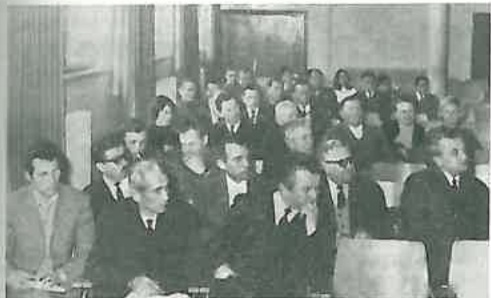
Delegati 7. sjednice