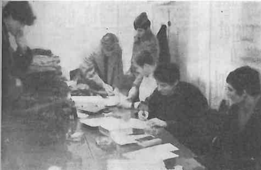
Slika 1. Uniforma, puška, opasac i ostala oprema interesantna je i danas za mlade. U štabu omladinskog odreda radi se punom parom. Omladinci i omladinke pripadnici omladinskog odreda proučavaju uniforme.