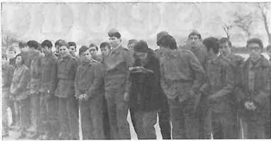
Slika 4. Ne može se reći da je to bespriječan vojnički stroj. Ima nas svakojakeh, velikih, malih, propisno obučanih, nepropisno obučanih, opasanih, neopasanih. Ali to za nas i nije važno. Važno je da mi volimo svoju zemlju i da ćemo ju ako ustreba zdušno braniti, tko u regularnoj armiji kada za nju stasa, tko u našem kraju na hiljadu i jedan način.

Danas 25 godina nakon oslobodilačkog rata, mladi, svi koji su se rodili poslije rata, upravo u cilju osposobljavanja za razne zadatke u eventualnoj potrebnoj odbrani naše zemlje osnovali su omladinski odred. Osnivanje omladinskog odreda ne znači formiranje i obučavanje regularnih jedinica, koje ćemo u slučaju eventualnog ratnog sukoba poslati na front, već upravo osposobljavanje mladih za eventualnu ratnu potrebu u cilju svenarodnih priprema za obranu naše zemlje.