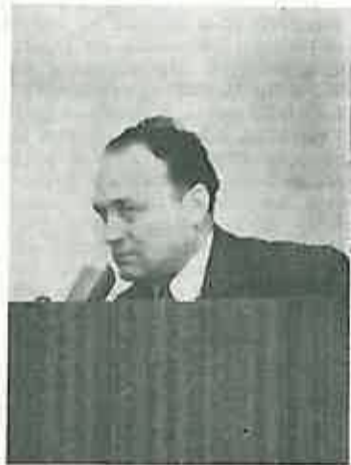
Član Gradskog komiteta SKH Zagreb govori delegatima 7. sjednice Općinskog komiteta SKH Dugo Selo

U protekle 2 godine preko Općinske konferencije i njezinih komisija okupili smo vrlo velik broj komunista na osnovnim pitanjima našeg partijskog rada. Gledajući u cjelinu mislim da možemo biti zadovoljni, naročito ako kod davanja ocjene podemo od toga da je to nešto novo u našem radu. Iz prilično dugog razdoblja tzv. »politike nemiješanja« ušli smo u fazu kada se od svakog komunista traži aktivan, angažiran stav u