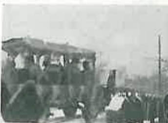
Trenkovi panduri Rugvičkog Črnca

Ujedno smo dobili sliku Trenkovi pandura Rugvičkog Črnca pa ju sada naknadno objavljujemo.