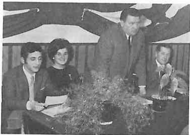
Članovi SK „Budućnost”

spomenuti da su postignuti rezultati u radničkom samoupravljanju gdje su komunisti svojim stavovima mnogo doprinijeli da radničko upravljanje bude na potrebnoj visini. U diskusijama u kojima