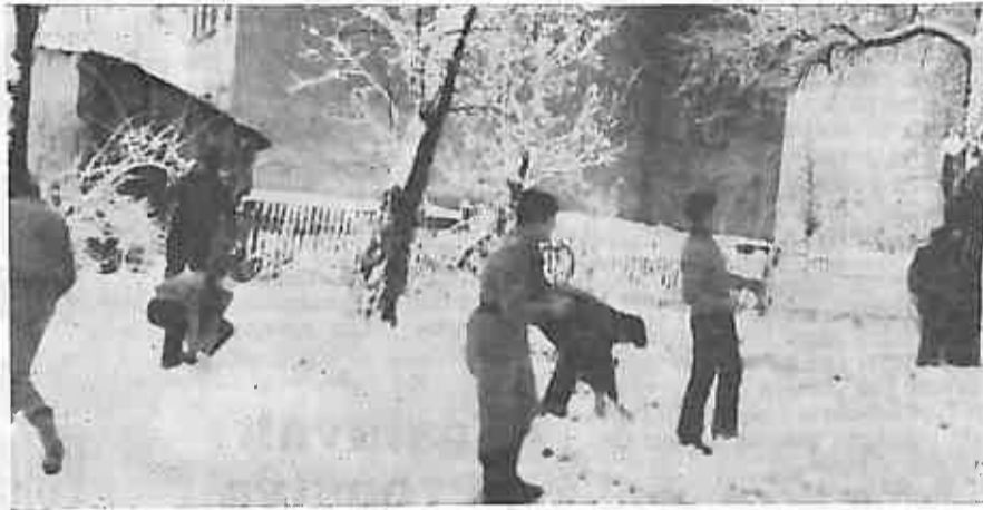
Slika 5. Prva akcija odreda Ježeva. Bilo je prijedloga da marširamo sve do Ježeva, tog mjesta starih ježevečkih komunista. Nismo bili protiv. Međutim, kada je štab odredio da se jedan (istina daleko veći) dio puta vozimo autobusom pozdravili smo pijeskom. Nakon akcije ugodno je bilo pozabaviti se s omladinom Ježeva, a i jedna prava borba grudanjem nije izostala.