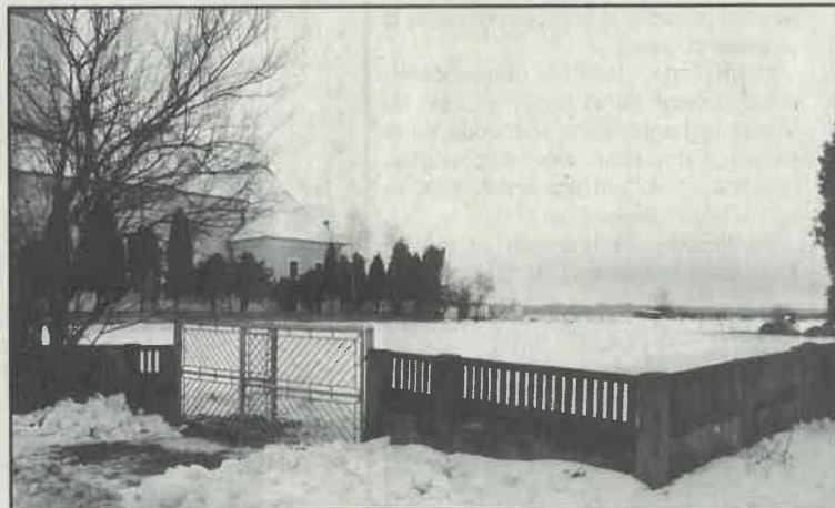
Općina će uskoro urediti prostor novog groblja