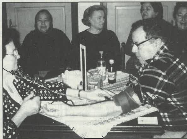
Klub hipertoničara u Kopčevcu

Crveni križ Dugo Selo namjerava i u ovoj godini nastaviti sve dosadašnje