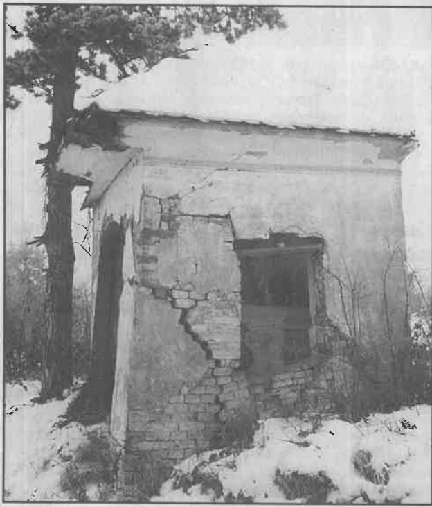
Nužna bi bila obnova i ove Kapelice na Martin Bregu!

ZAGREBAČKA ŽUPANIJA, OPĆINA DUGO SELO, Upravni odjel za komunalno i stambeno gospodarstvo, 10370 Dugo Selo, Ulica A. Mihanovića 1.