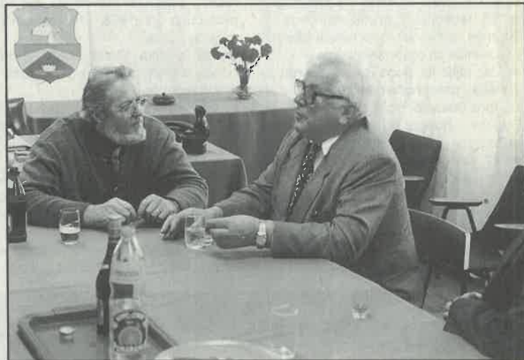
Načelnici dviju općina sagledali su značaj mosta preko Save

načelnici - a znatno bi moslavačku županiju. Povezivanje pojednostavio i skratio put od Siska lijeve i desne obale Save mostom u do Zagreba uz samu rijeku, što bi Oborovu značajno je za ovaj dio imalo značaj i za Sisačko-Posavine koji je u prometnom