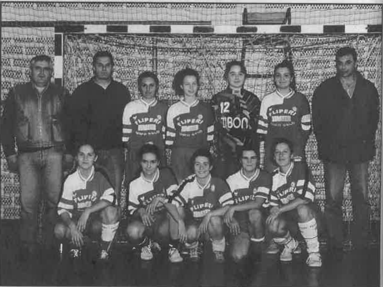
Među uspješnim športašima bili su članovi RK Dugo Selo 1955. Za ostvarene rezultate i 40 obljetnicu rada dobili su Godišnju nagradu općine - '96