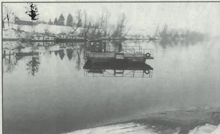
Od Zagreba do Siska samo je Oborovska skela sposobna za ozbiljan prijevoz preko Save

smislu dosad zaobilazan, pa izumire u demografskom smislu. Izgradnja mosta značila bi početak njegove demografske i gospodarske obnove. Općine Rugvica i Orle nisu same u stanju isfinancirati izgradnju mosta - također se čulo na sastanku - jer primjerice, oba općinska proračuna za ovu godinu zbrojena zajedno ne dostižu 4 milijuna kuna. Logično bi bilo da izgradnju mosta financira "šira društvena zajednica" kojoj bi demografska i gospodarska obnova Posavine trebala biti od značaja - kažu inicijatori - predlažući ipak jeftiniju pontonsku varijantu mosta za koju bi se mogli iskoristiti već postojeći prilazi i rampe koje sada koristi skela u Oborovu. NHM