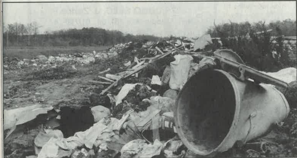
Komunalni otpad zatrpao je okoliš. U 1996. najavljena su nova, trajna rješenja za zbrinjavanje

• 18. prosinca otvorena je u Narodnom sveučilištu izložba slika u emailu - autorice Zorice Balija.