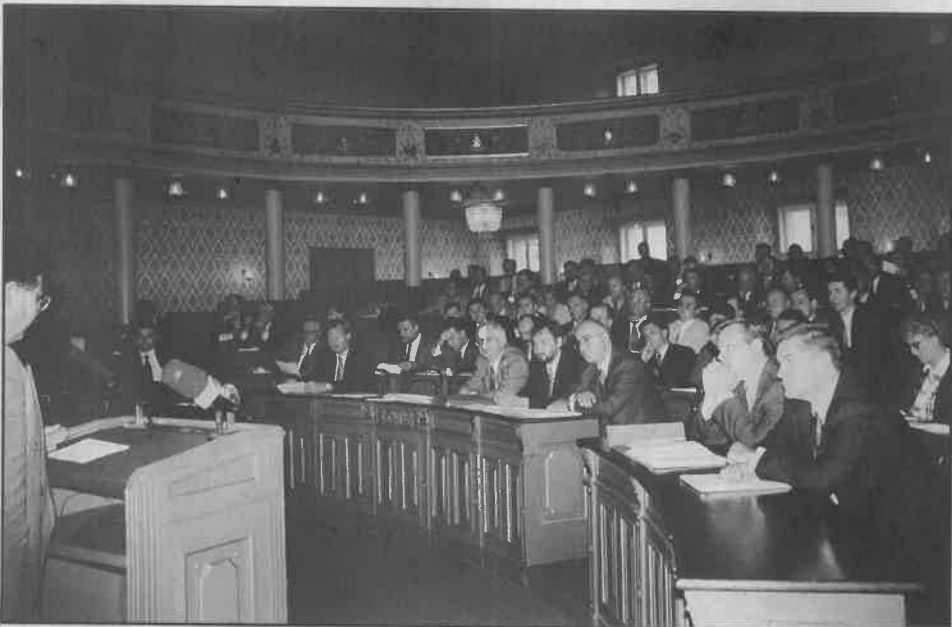
Stara gradska vijećnica pamtit će 1996. godinu po teškim raspravama koje nisu dovele vijećnike do izlaska iz zagrebačke krize!