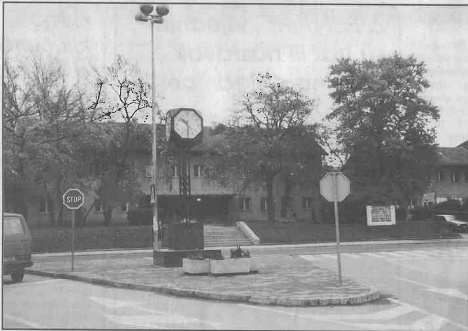
Dugoselsko gradsko središte

Na tom prostoru registrirano je 440 gospodarstvenih subjekata, a čak 5,5 tisuća stanovnika radi u Zagrebu. Naš novi grad ima proračun od 15 milijuna kuna. U tijeku je gradnja tržnog