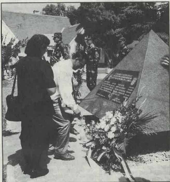
Prošle je godine u Dugom Selu podignuto spomen obilježje poginulim braniteljima u Domovinskom ratu

• U Rugvici, tijekom ožujka održana je javna rasprava o izmjenama i dopunama Plana prostornog uređenja.