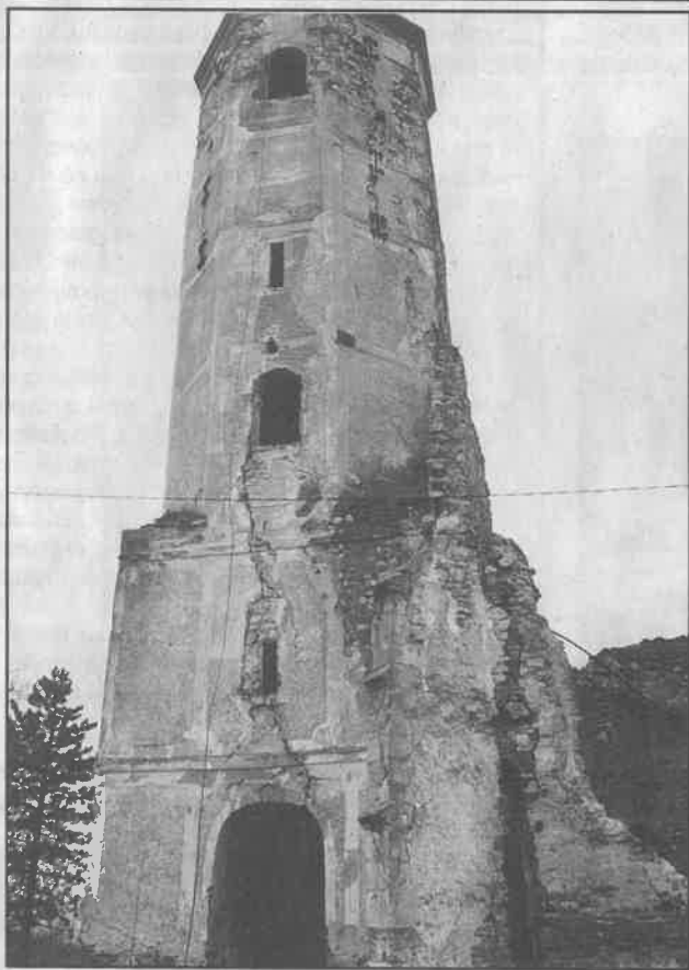
Svi koji mogu i žele pomoći na obnovi ovog spomenika prve kategorije, mogu se uključiti u odbor

Zagrebačka županija, općina Dugo Selo, Ulica J. Zorića 1, Dugo Selo na osnovu članka 46. Odluke o komunalnom redu (Službeni glasnik općine Dugo Selo br. 14/96) raspisuje