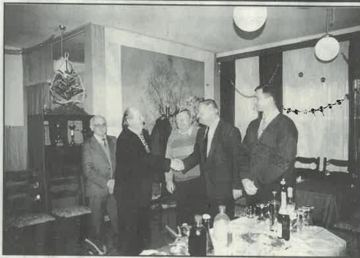
Svečani prijem povodom otvorenja kluba umirovljenika

Povodom otvorenja novouređenih prostorija umirovljenici su krajem protekle godine organizirali prijem za predstavnika Općinskog poglavarstva i Vijeća. Tom su se prigodom zahvalili na razumijevanju i potpori svima koji su im dodijelili nove prostore na korištenje kao i na novčanoj potpori za uređenje kluba. Zahvalili su