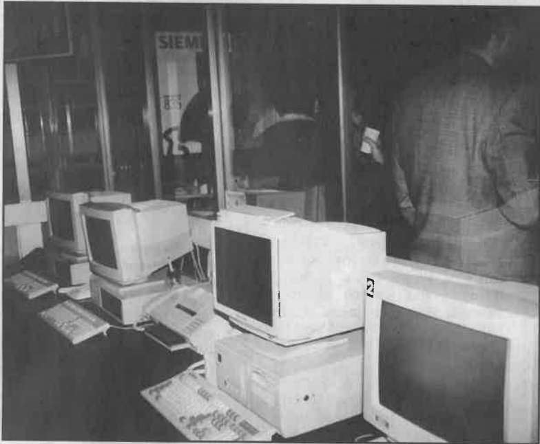
Otvorenje nove telefonske centrale, uvođenje telefona u Rugvici i Brckovljanima - značajni su događaji za građane!

Realizaciju tih i drugih započetih aktivnosti pratit ćemo i ubuduće.