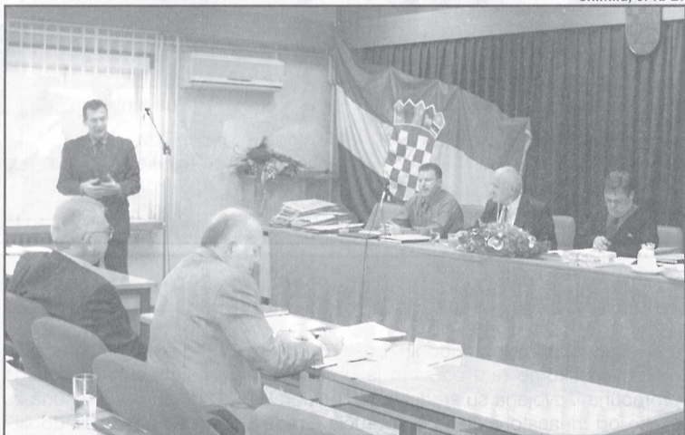
U Dugom Selu održana Skupština izvršnog odbora športskih udruga i saveza Zagrebačke županije