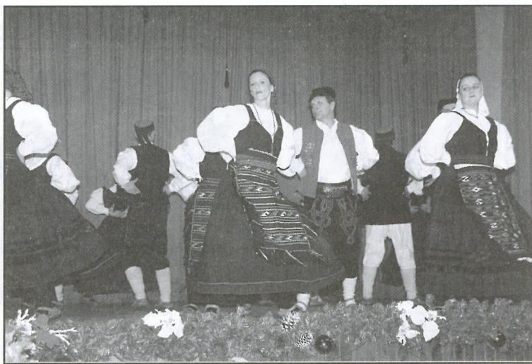
Preporodovi veterani izveli plesove iz Like