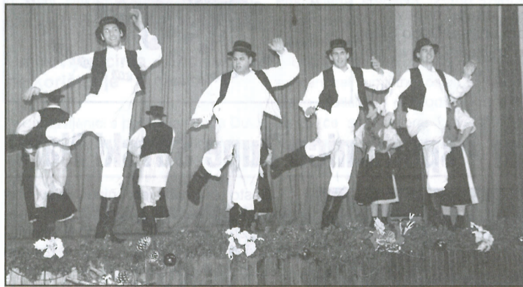
Temperamentna dionica međimurskih plesova