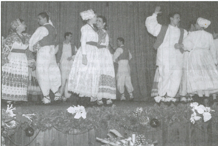
Rado viđeni plesovi i pjesme iz Posavine

Tradicionalnim cjelovečernjim koncertom članovi KUD-a "Preporod" uputili su čestitke svojoj publici koja ih prati tijekom cijele godine. Hrvatske pjesme i plesovi nizali su se na pozornici ukrašenoj blagdanskim nakitom u subotu 20. prosinca 2003. godine. Od bunjevačkih, slavonskih, posavskih, zagorskih i međimurskih plesova i pjesama vidjeli smo prikaz baranjske svadbe "Vranci se konji vataju". Izvedena je i Dubrovačka poskočica "Lindó", te stari plesovi s Otoka Hvara kojima su Preporodaši u ovom kontinentalnom sivilu dočarali dah s juga. Preporodovi veterani za ovu su prigodu izveli uvijek rado gledane narodne igre i plesove iz Like po kojima je naše društvo prepoznatljivo na brojnim smotrama u zemlji i inozemstvu. U završnici