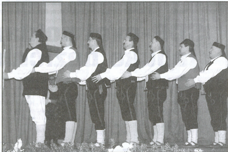
Izvedba ličke Vujanke često donosi nagrade na smotrama folklor