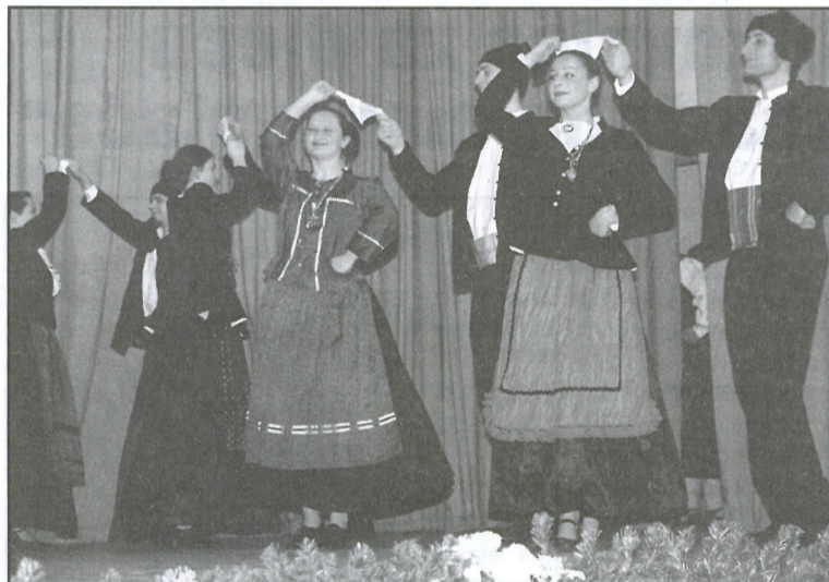
Stari plesovi s otoka Hvara - novitet na Preporodovu repertoaru