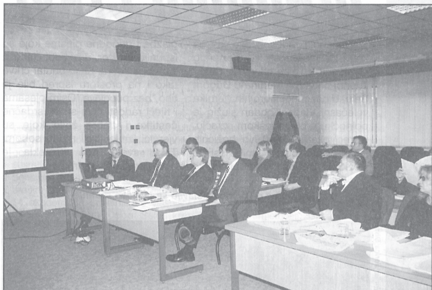
Gradski vijećnici na sjednici usvojili najznačajnije dokumente za predstojeću godinu detaljno analizirajući strukturu prihoda i izdataka

uključujući i kreditna sredstva za završetak sportske dvorane. U održavanje komunalne infrastrukture planirano je uložiti 3,2 milijuna kuna i to od prihoda s osnova naplaćene komunalne naknade. U komunalnu izgradnju planira se ulagati preko sedam milijuna kuna prema usvojenom programu.