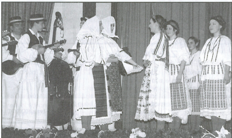
Prikaz baranjske svadbe u koreografiji "Vranci se konji vataju"