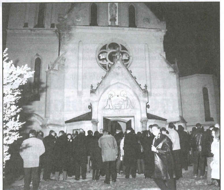
Pročelje crkve urešeno svjetlucavim motivom Isusova rođenja i brojni vjernici u dolasku na polnočku

◀ U župnoj crkvi na polnočki slavilo se Isusovo rođenje