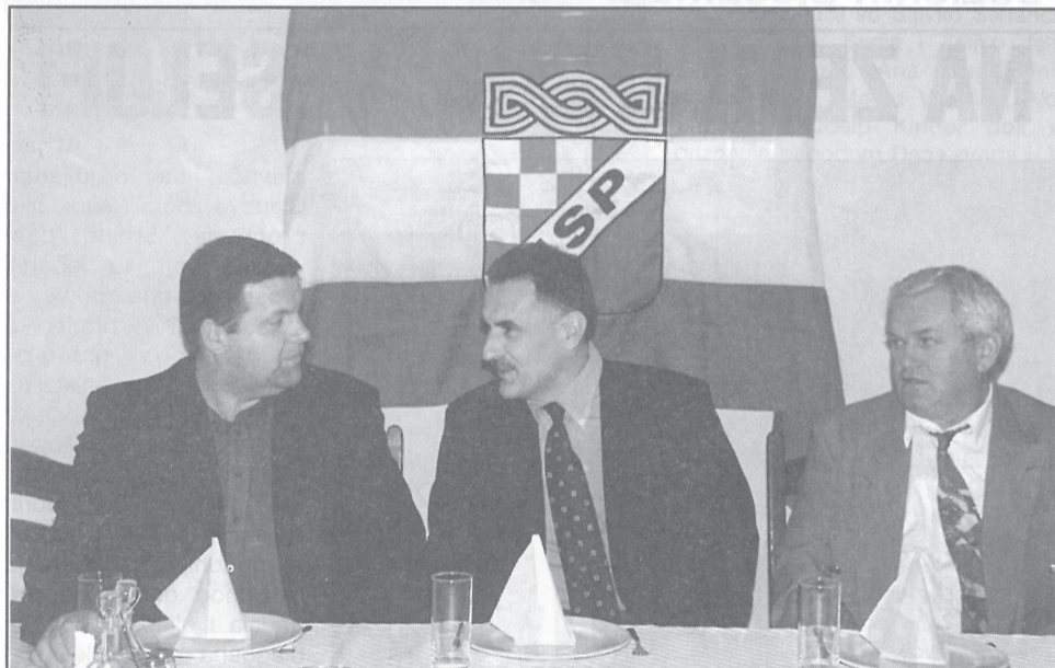
Na svečanosti prigodom obljetnici istaknuti postignuti rezultati