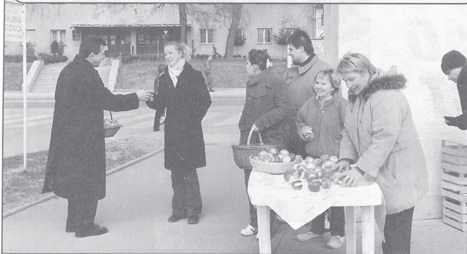
SDP-ovci su "božićnicama" izrazili najbolje želje povodom Božića i Nove godine