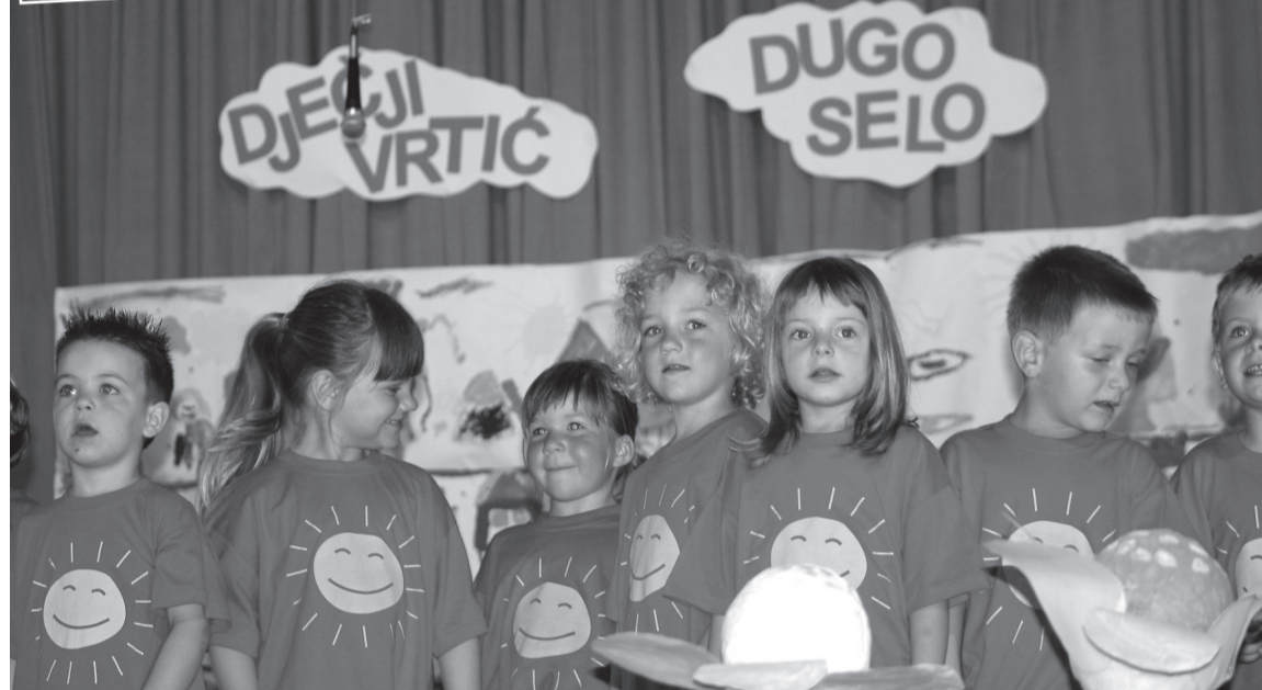
U Gradskom vrtiću smještno 313 djece dok 46 djece čeka na smještaj – Poglavarstvo ukazalo na potrebu prikupljanja dokumentacije i traženja lokacije novoga vrtića

proširio brigu na potrebe djece koja nisu u vrtićima zbog objektivnih ili subjektivnih razloga. Time se ujedno poboljšava standard djece. Napomeno je kako se time ne sufinancira igraonica već dijete, a Grad za to godišnje izdvaja oko 3.000 kuna. Članovi Poglavarstva prihvatili su i prijedloge ugovora o sufinanciranju programa predškolskog odgoja drugih osnivača. Na području Grada dva su takva vrtića – «Buba Biba» i «Didi». Grad više neće uvjetovati odbijenicu gradskog vrtića koja je prije bila potrebna za upis u privatne vrtiće. I dalje će sufinancirati s 1.000 kuna mjesečno po djetetu, kao i u gradskom vrtiću. Vlasnici vrtića tražili su povećanje cijena smještaja zbog povećanja troškova, a na teret Grada što je bilo neprihvatljivo jer Grad ne želi raditi razliku u sufinanciranju smještaja djece u gradskom vrtiću. Kako je rečeno na sjednici, privatni vrtići trebali bi sami uskladiti svoje financijske konstrukcije te kako se Grad ograđuje od povećanja njihovih cijena. Grad ima visoki natalitet i stoga je gradonačelnik Vlado Kruhac kazao kako treba razmišljati o novom vrtiću, početi prikupljanje potrebne dokumentacije i traženje lokacije. Po podacima društvenog odjela u «Bubi Bibi» je 50 djece, dok je u «Didiju» njih 100. U Gradskom vrtiću (matičnom objektu i područnom u Lukarišću) je 313 djece. Na čekanju je 46 djece što je samo još jedan razlog za novi vrtić – čulo se na sjednici. Također, utvrđen je iznos od 1.200 kuna jednokrat-