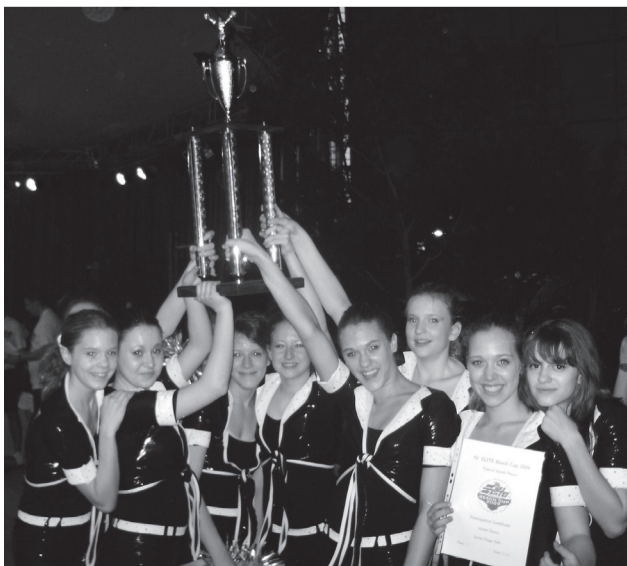
Uspješne Cheerleaderice marljivo treniraju i postižu rezultate