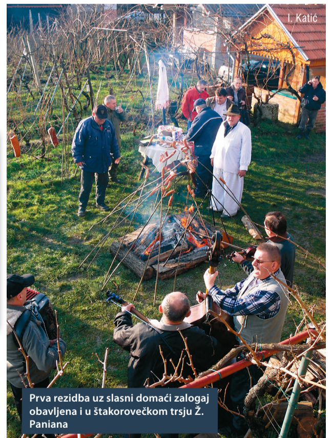
Prva rezidba uz slasni domaći zalogaj obavljena i u štakorovečkom trsju Ž. Paniana