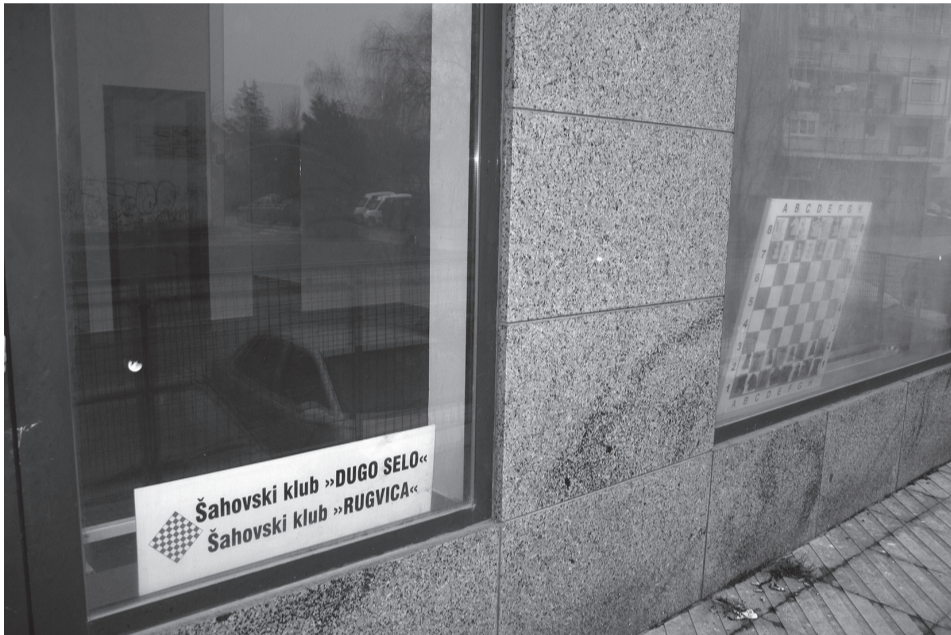
Ispred novog prostora u Kažotićevoj ulici

- Pozivamo roditelje djece od 7 do 10 godina koja bi se htjela baviti šahom da dođu u