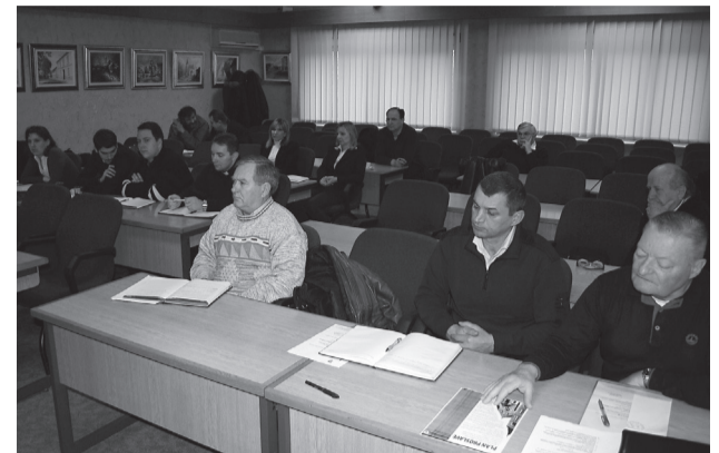
Obilježavanju vrijedne obljetnice pridonijet će mnoge ustanove, udruge, župska zajednice i grad u cjelini – mnoge programe i prijedloge poželjno je objediniti

Crkva i župa, kao ishodnica jubileja i osam stoljeća postojanja na ovom području, bit će i središnja jubilejskoga slavlja.