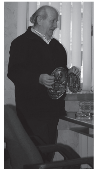
Umirovljenici predlažu izradu suvenira s prepoznatljivim znakovljem grada, martinske crkve i jubileja